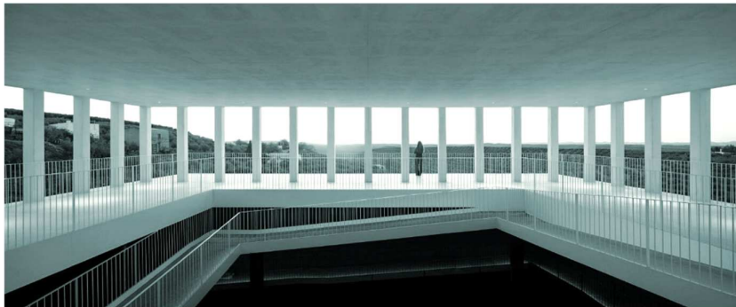
La transparencia no debe restar visibilidad

Recursos internos. El Consejo carece de aplicaciones de gestión internas más allá de herramientas básicas, recurriendo en múltiples ocasiones a la memoria del personal del Consejo para buscar y encontrar determinados asuntos. Debemos dotar al Consejo de las herramientas informáticas necesarias para el correcto ejercicio de su actividad, puesta a disposición de Consejeros y asambleístas de manera que repercutan en una mayor agilidad, eficacia y transparencia.